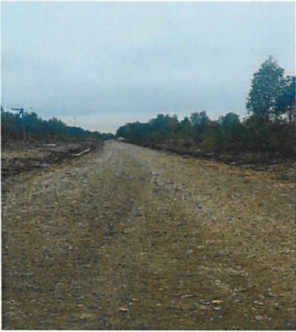
Kuva 3 Tien ravien kaivuuta