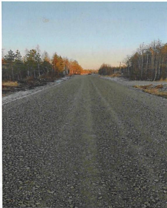
Kuva 6 Murskeiden asennusta