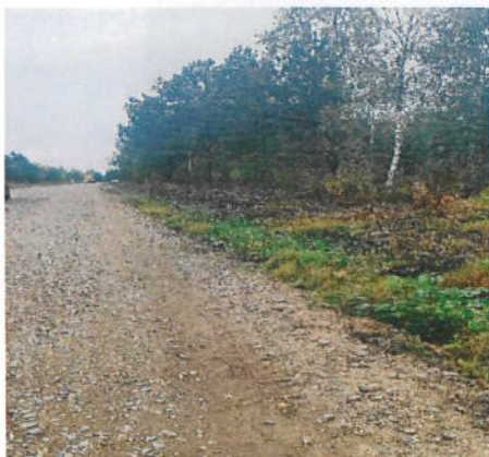
Kuva 1 Ravien raivausta

Puhdistamontien tason parantaminen aloitettiin 1.9.2023 raviojien puhdistamisella ja kaivuulla.