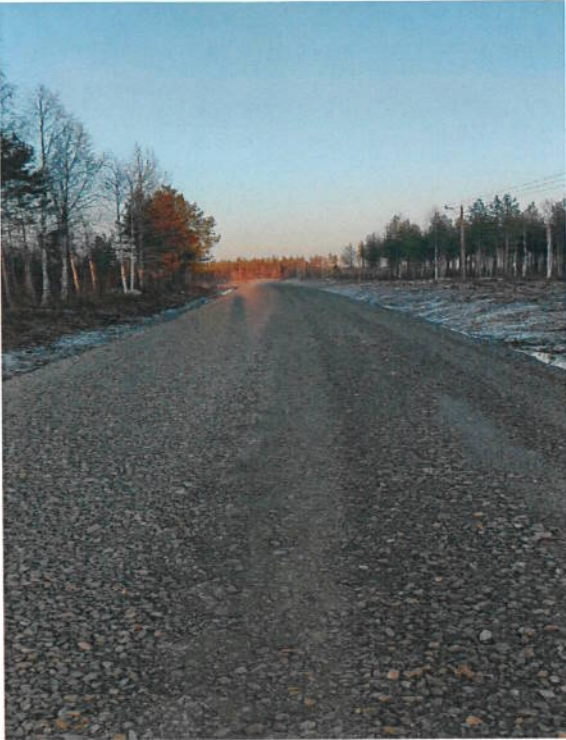
Kuva 7 Murskeen asennusta