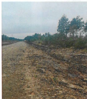
Kuva 2 Luiskien kaivuuta ja muotoilua