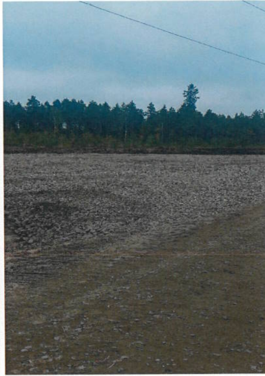
Kuva 8 Kääntöpaikka Puhdistamontien päässä