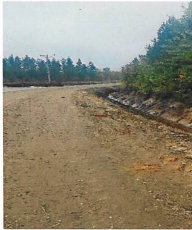
Kuva 4 Tien ravien kaivuuta

Raviojien kaivuun yhteydessä vesitaloutta parannettiin asentamalla 3 kpl uusia rumpuputkia.